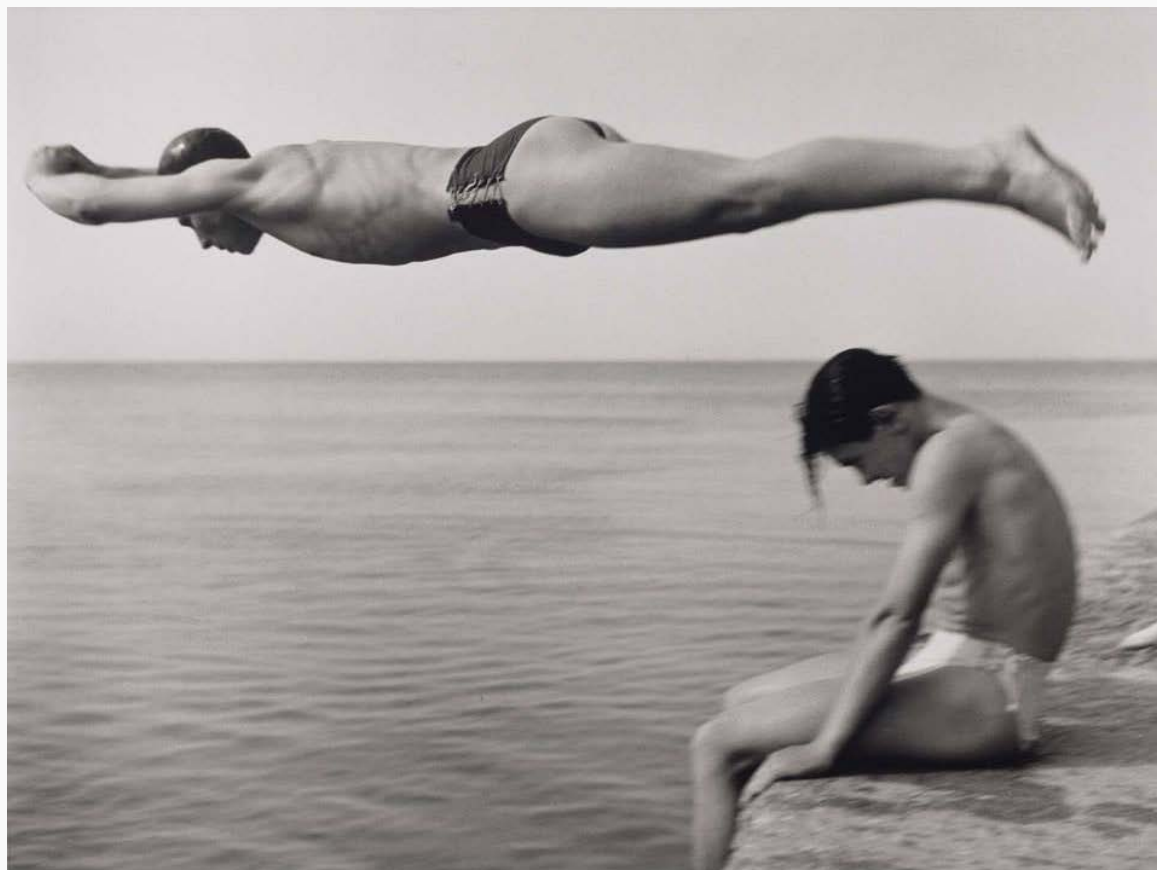
Nino Migliori, "Il truffatore", 1951