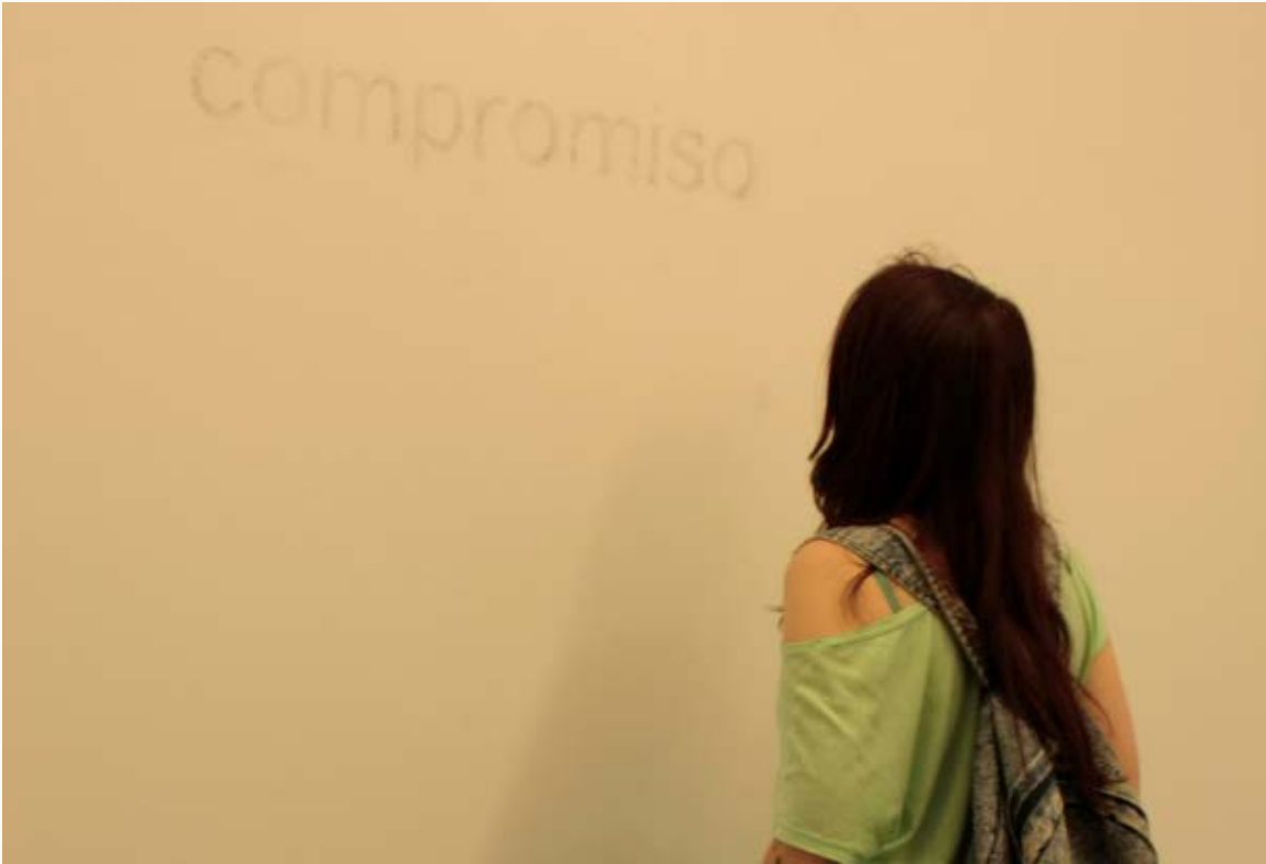
Somos Nosotros. "Nada que ganar, nada que perder". 2015 (Detalle de la instalación)