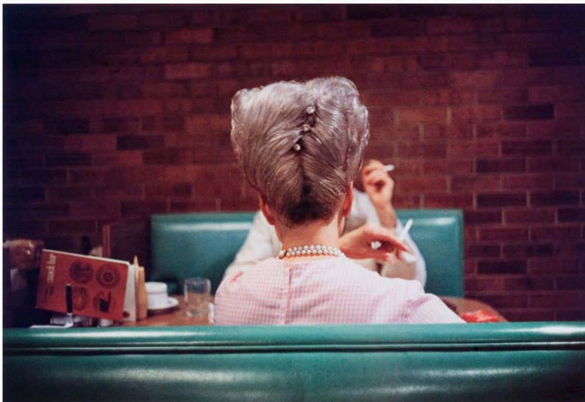
William Eggleston, "Los álamos", 1965-1968