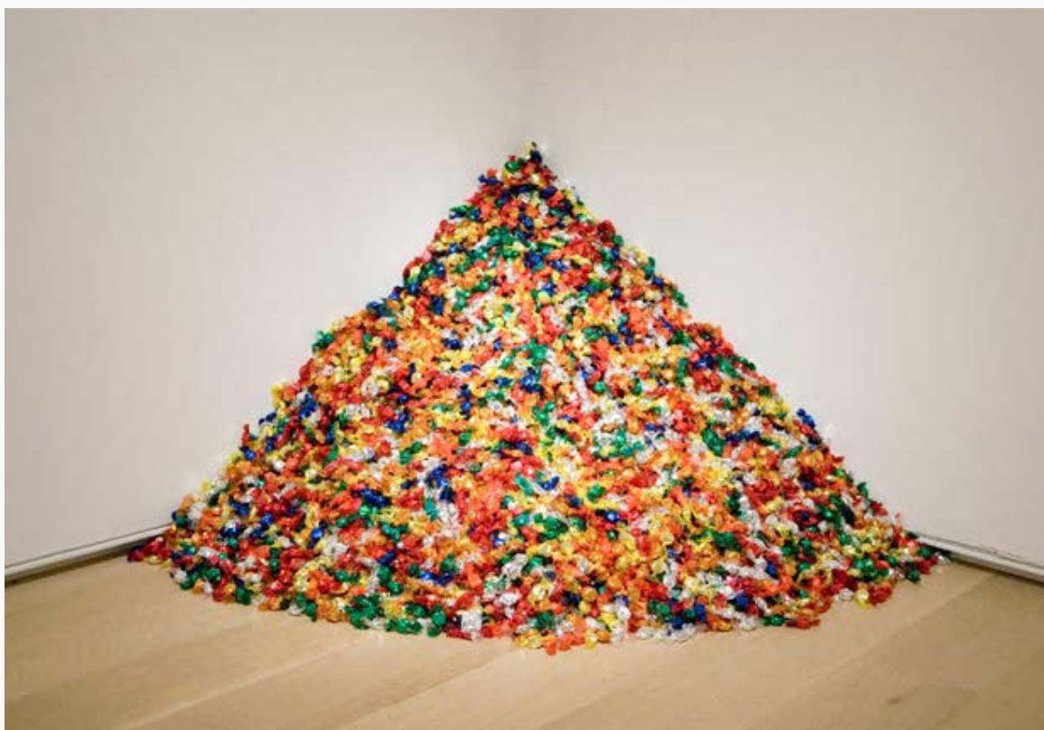
Félix González-Tórrres. "Untitled" (Portrait of Ross in L.A.). 1991

JUST RESIDENCE 2017: Por cuarto año consecutivo, JustMAD celebra una nueva edición del programa de residencia internacional Just Residence. La residencia consiste en un período de 4 semanas que ofrece a los artistas residentes la oportunidad de disfrutar de una experiencia creativa en un entorno nuevo y en convivencia con otros artistas de diferentes procedencias. Hasta el 10 de octubre de 2016. [+ info]