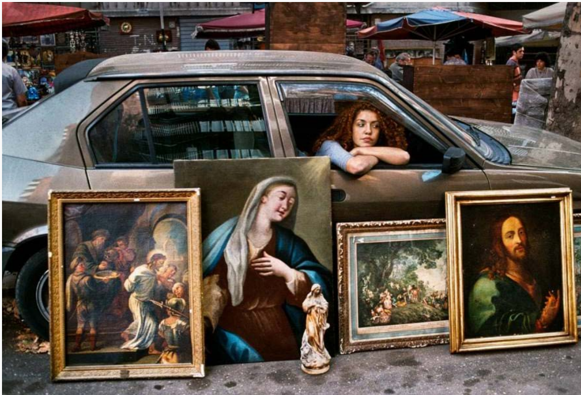
Steve McCurry. Rome 1994

CONVOCATORIA PARA LA FINANCIACIÓN DE PROYECTOS DE INVESTIGACIÓN CASA DE VELÁZQUEZ- UNIVERSIDAD COMPLUTENSE DE MADRID: La presente convocatoria tiene como objeto regular el procedimiento de concesión en régimen de publicidad, objetividad y concurrencia competitiva, de ayuda económica para un máximo de dos proyectos de investigación conjunta bienal entre investigadores de la Universidad Complutense de Madrid e investigadores vinculados a la Casa de Velázquez. Plazo de solicitud: del 5 al 28 de octubre de 2016. [ + info ]