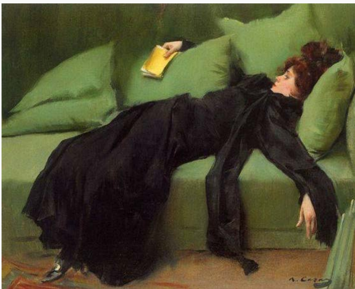
Ramón Casas 1910