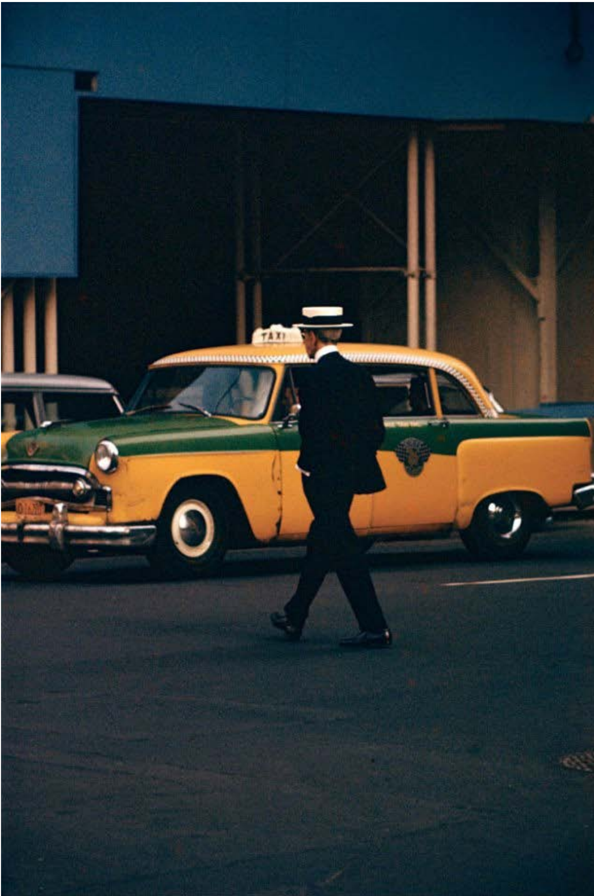
Saul Leiter Man with Straw Hat