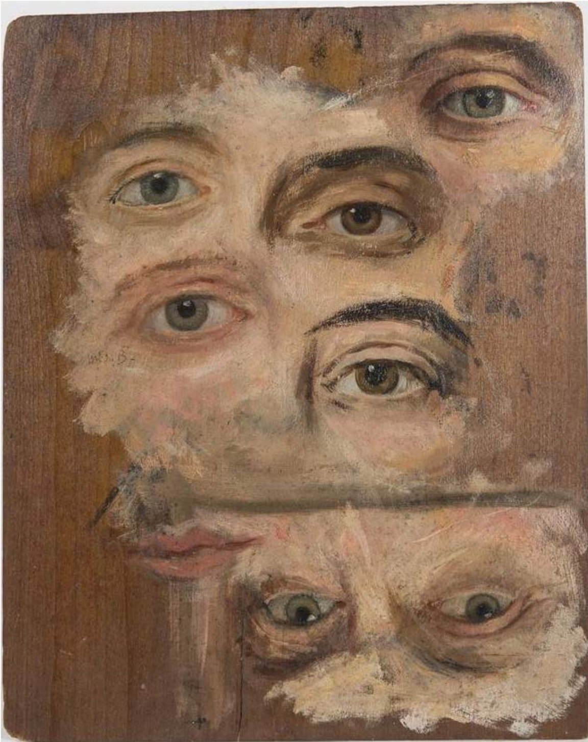
Estudio de ojos. Autor desconocido, s. XIX