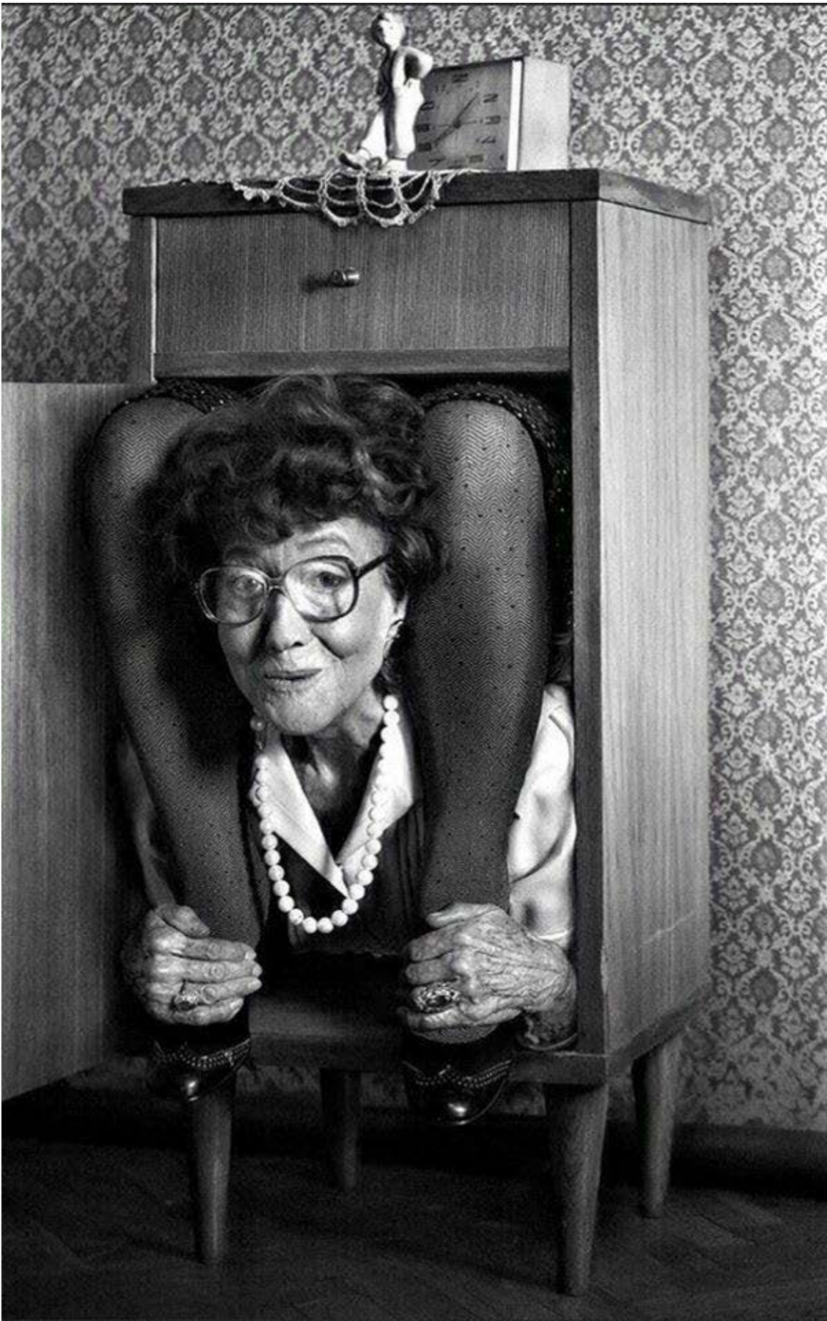
Cartel de una mujer con un collar de ojos