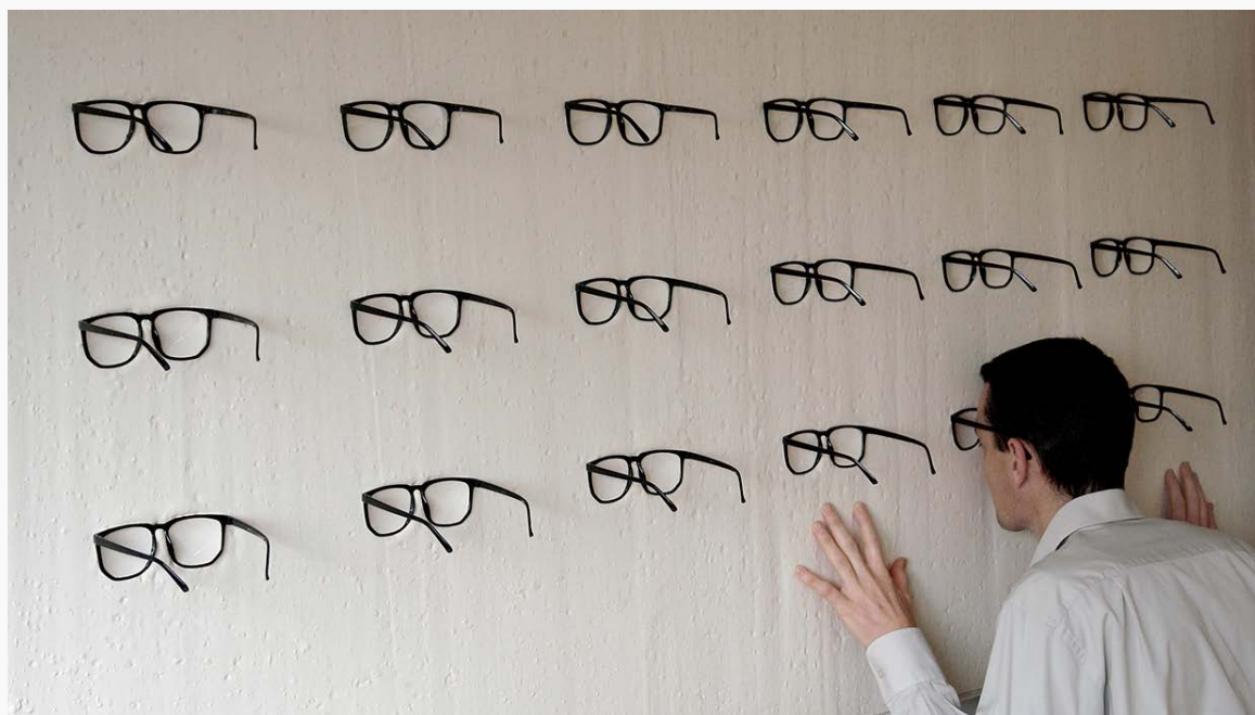
Marc Sommer, Dix-huit façons de ne rien voir, 2014

ABIERTO: Convocatoria abierta todo el año a la que pueden concurrir profesores y alumnos de la Facultad de Bellas Artes que quieran realizar proyectos expositivos de arte, diseño, conservación y restauración del patrimonio o comisariado, que reflejen el trabajo docente, creativo e investigador desarrollado en el Centro. [+ info]