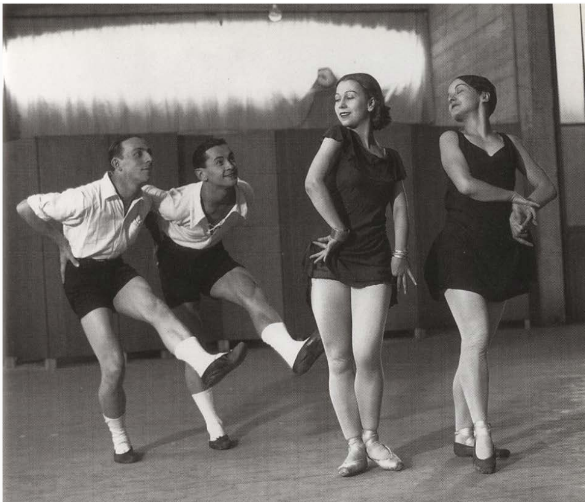
André Kertész, Ballet Ida Rubinstein, París, 1928