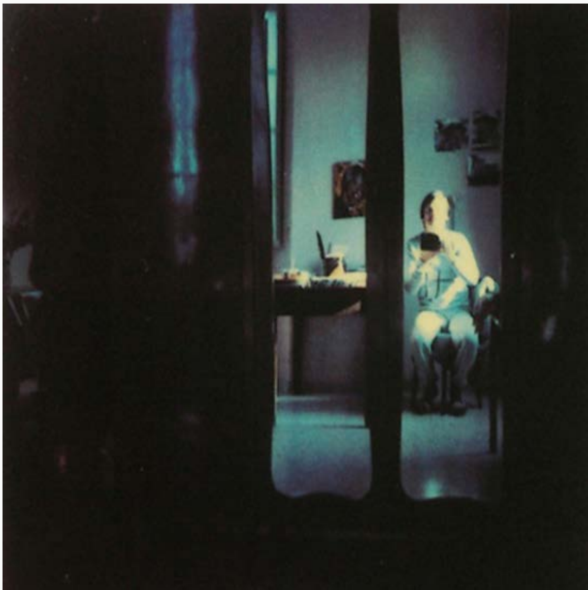
Autorretrato en polaroid, Andrei Tarkovski (entre 1979 y 1983)