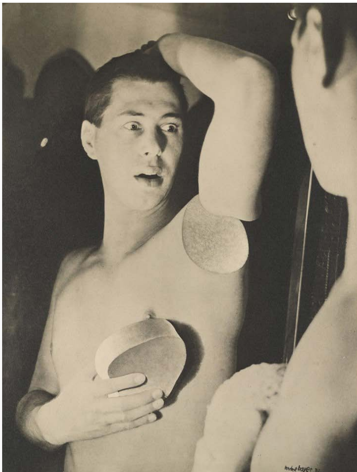
Bayer Herbert (1900-1985), Autorretrato (Bauhaus), 1932