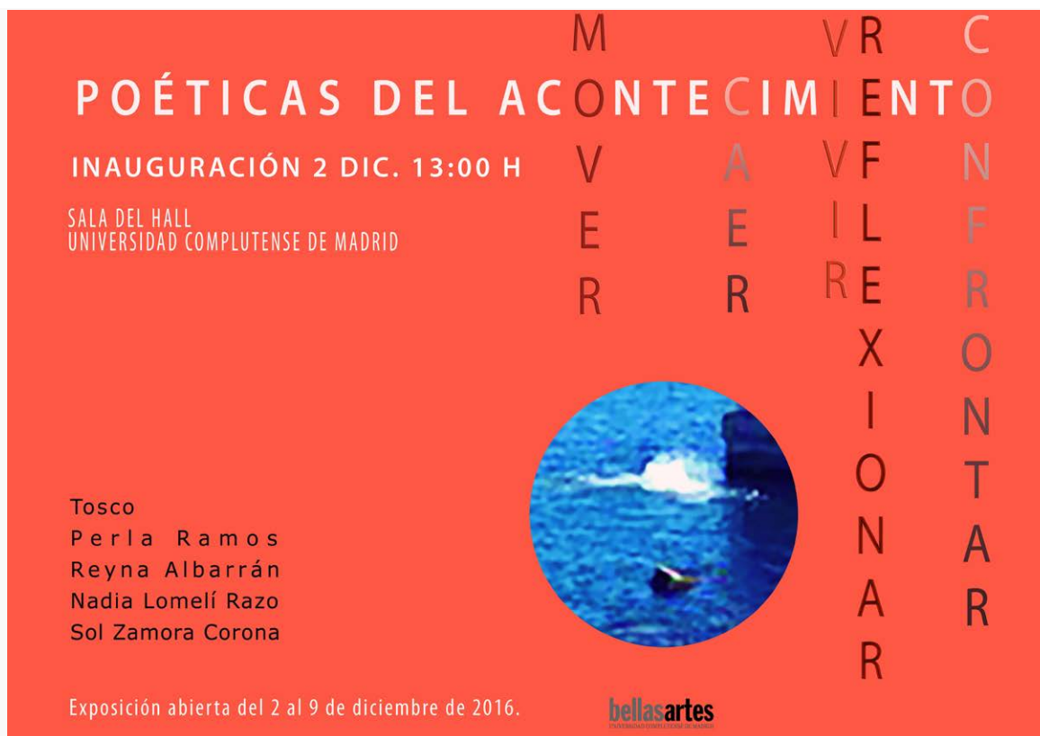
Cartel de la exposición 'Poéticas del acontecimiento'