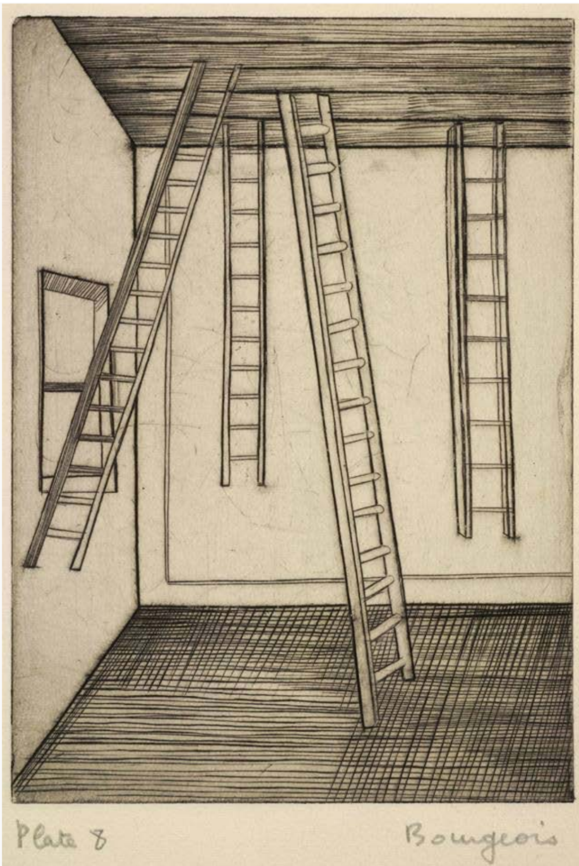
Louise Bourgeois, "He Disappeared into Complete Silence", 1947