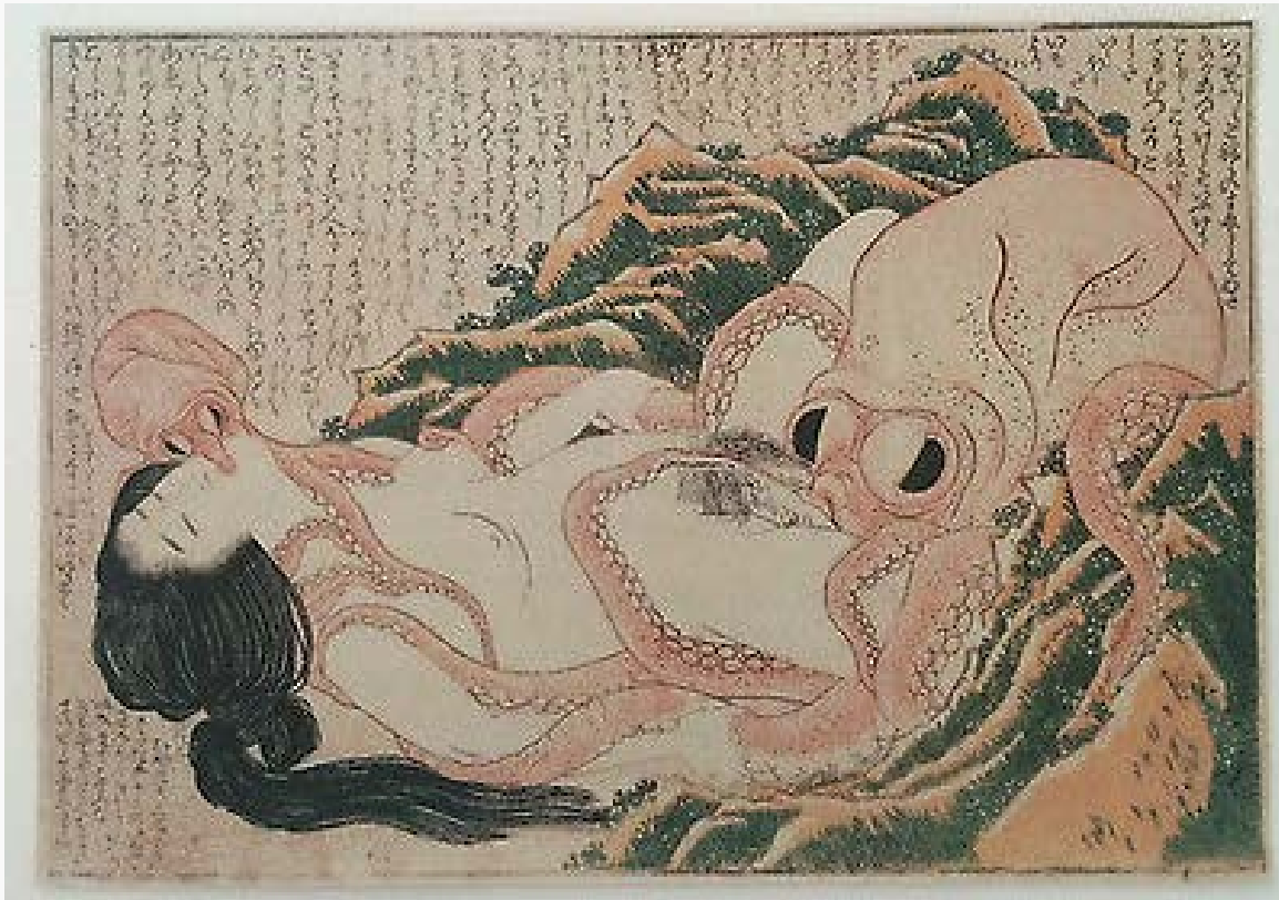
Katsushika Hokusai, "El sueño de la esposa del pescador", xilografía (ukiyo-e), 1814