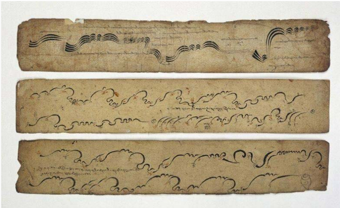
Anotaciones musicales tibetanas