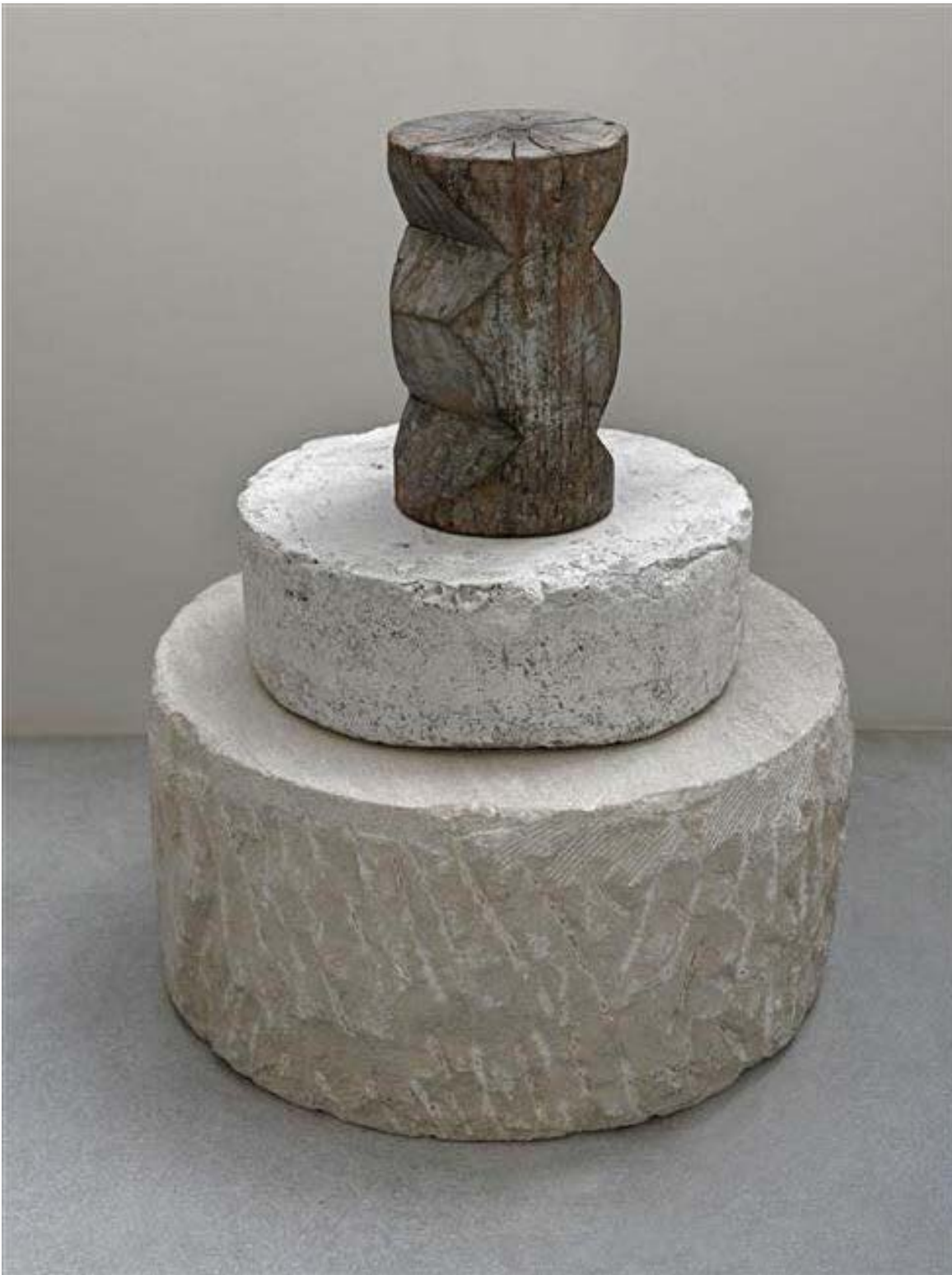
Constantin Brancusi, Colonnnette, 1930