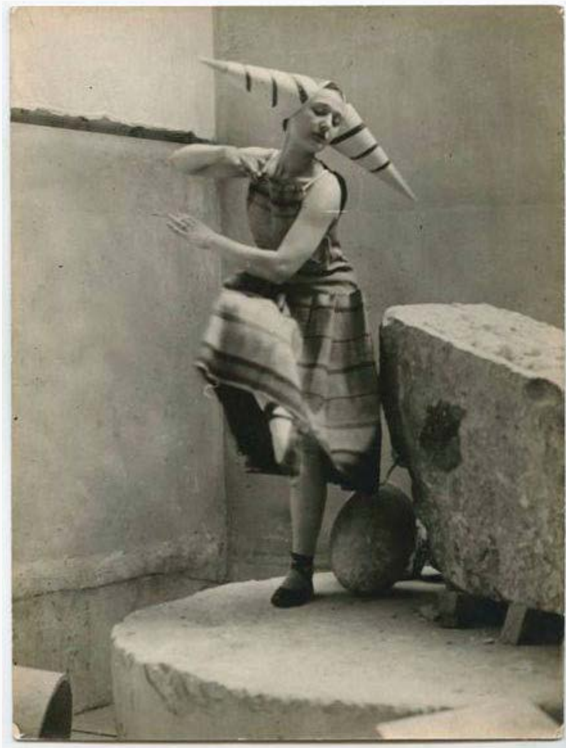
Constantin Brancusi, Vestuario para las Trois Gymnopédies de Erik Satie, 1922.