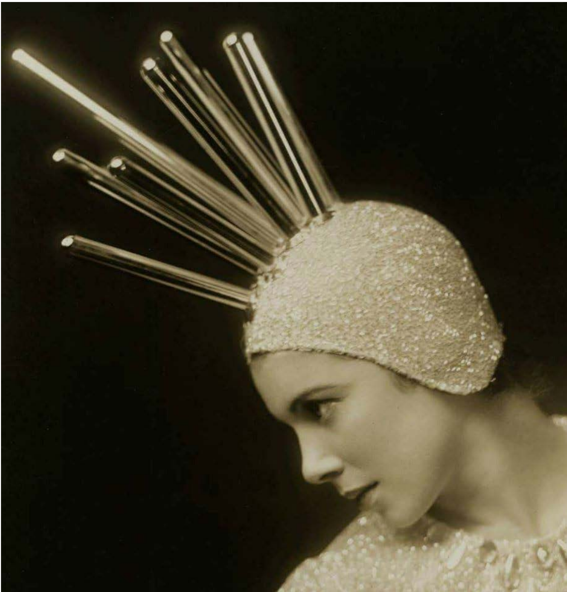
Retrato de Tilly Losch (Otilie Ethel Leopoldine Herbert, Condesa de Carnarvon), bailarina y pre-performer (1903-1975)