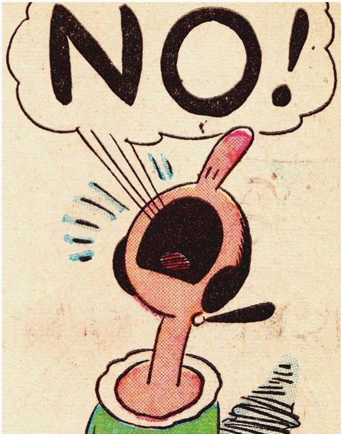
Olvia, (personaje de Popeye el Marino)

LA OBRA SOCIAL 'LA CAIXA' CONVOCA BECAS INTERNACIONALES Y NACIONALES PARA CURSAR ESTUDIOS DE POSGRADO en AMÉRICA DEL NORTE Y LA ZONA DE ASIA-PACÍFICO (hasta 04-04-17): [ + info ]