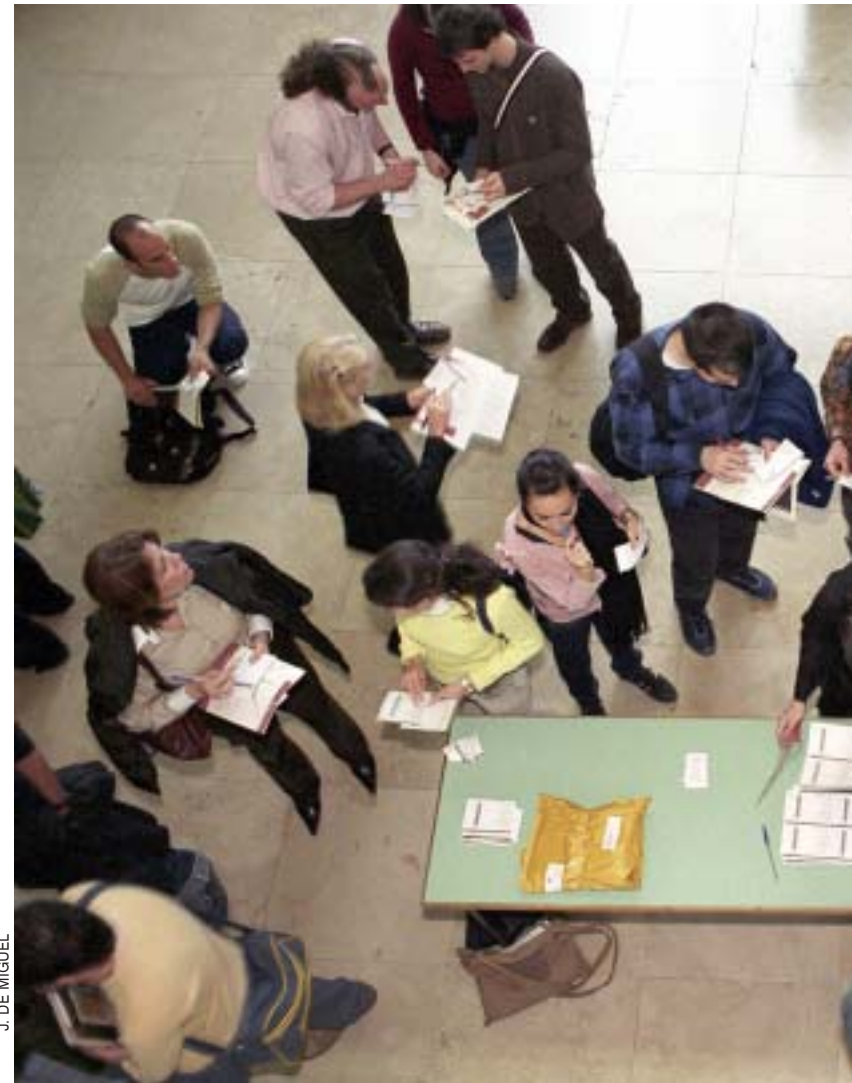
J. DE MIGUEL

Los libros inspiran y los artistas siempre lo aprovechan. Es el caso de Gonzalo Escarpa, quien con su voz, unos versos, juegos de luces y tonos musicales es capaz de crear un espectáculo de gran calidad.