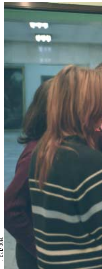
J. DE MIGUEL

La actual muestra se podrá visitar hasta el 18 de marzo y será sustituida por otra de diferente título, pero con la misma temá-