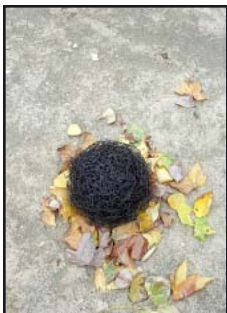
J. DE MIGUEL

La jornada cultural Exprésate contará con un pasacalles interpretado por grupos teatrales complutenses, con representaciones artísticas que aprovecharán el entorno del Jardín Botánico y, entre otras cosas, con una exhibición de graffiteros . Las imágenes del reportaje se corresponden con las actuaciones de la primera edición de Exprésate celebrada el curso pasado.