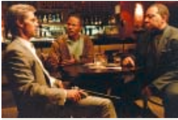
▶ Collateral (2004)

El director Michael Mann dirige una película con muchos aciertos y un gran fallo: el final. Como no vamos a contar el desenlace (que cualquiera puede imaginar sin necesidad de ver la película), lo mejor es pasar a las cosas buenas. Lo primero que se puede destacar es la calidad de las imágenes. Michael Mann optó por la película estándar de 35 mm. sólo en las escasas escenas diurnas con las que arranca el filme, a partir de ahí (el otro 90% de la cinta) está rodado con cámaras digitales de alta definición. Gracias a la técnica descubrimos una ciudad de Los Ángeles, que aunque la hayamos visto miles de veces parece totalmente distinta. Las luces son más reales, el cielo parece de verdad y la textura de la propia película tiene un cierto aire documental, pero sin perder la esencia del cine (algo que desaparece de raíz en las películas rodadas con video digital).