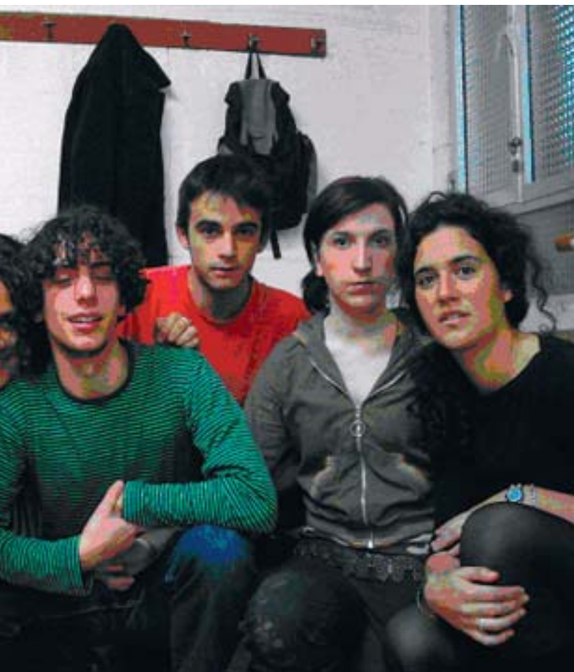
J. DE MIGUEL