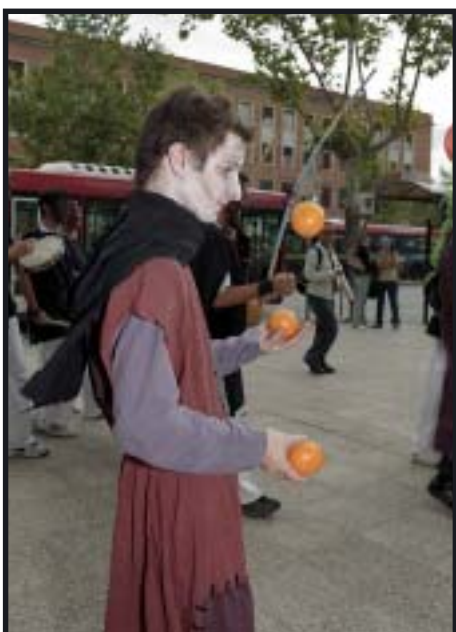
J. DE MIGUEL

Llueva a no, el día 21 de octubre la Universidad Complutense inaugura una programación cultural que promete ser mucho más intensa de lo que ha sido nunca.