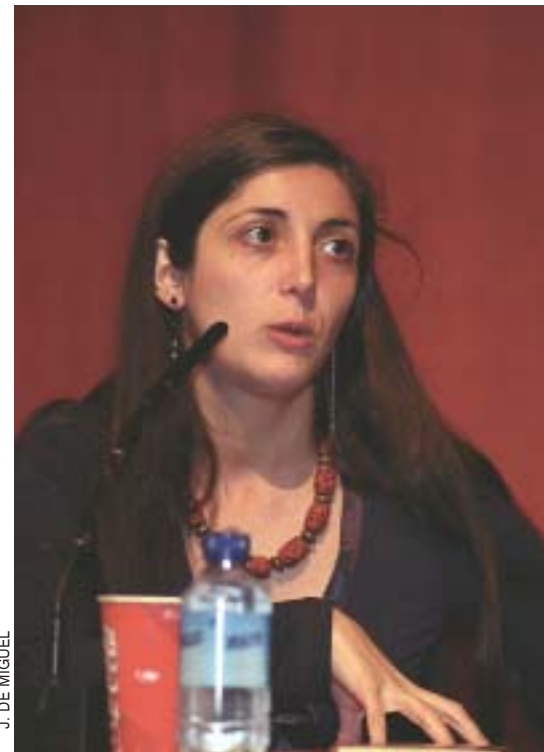
J. DE MIGUEL