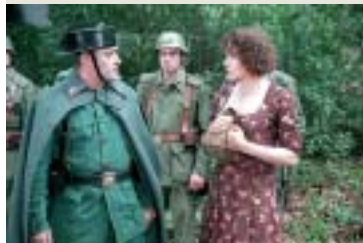
► El año del diluvio (2004)

Eduardo Mendoza es uno de los escritores más reputados de nuestro país, pero no consigue que el cine le haga justicia. Las adaptaciones resultan siempre frías y aburridas, como demuestran las dos últimas, La ciudad de los prodigios (Mario Camus, 1999) y El año del diluvio del director Jaime Chávarri.