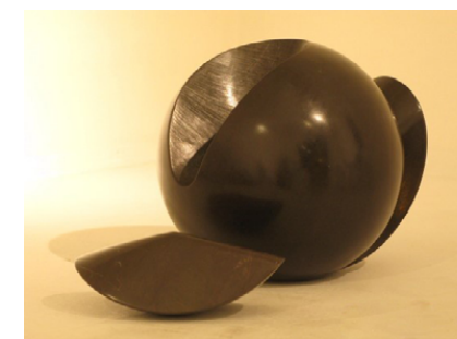
(Fig. 1) ITINERARIO, 1999. Granito silvestre, 145x130x105cm. I Simposio Internacional de Escultura "Arte y Naturaleza no Monte Alba", Vigo.