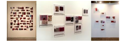
2011. Serie The revealing veil