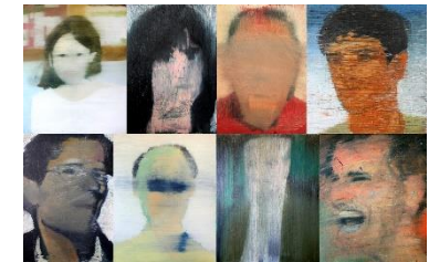
2012. Serie Los des aparecidos