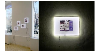
2015. Instalacion Spain is different