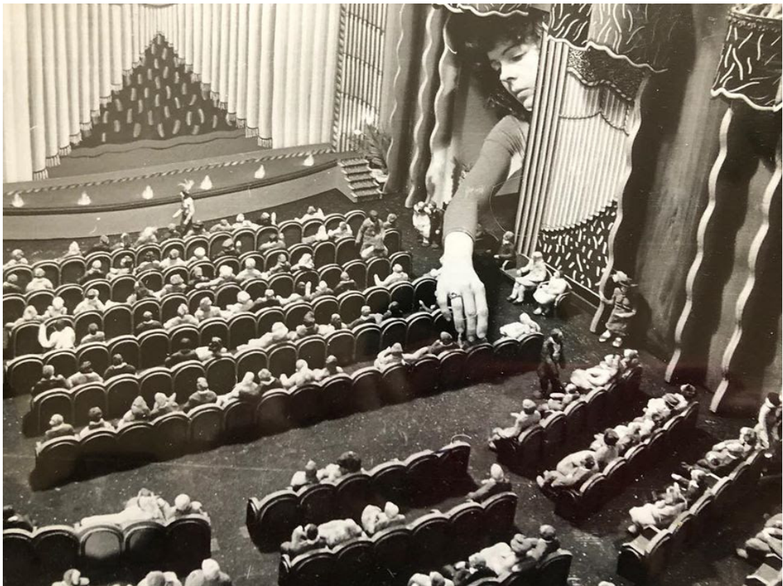
Suzan Pitt diseñando el set de la película de animación "Asparagus". 1978

BECA DE ARTE ENATE 2020: La Beca de Arte ENATE se convoca con el objetivo de apoyar a artistas no consagrados con una trayectoria contrastable, que quieran aportar su visión en el mundo del vino. Las obras, que deberán ser inéditas y de temática y técnica libre, tendrán que tener una medida no inferior a 97 cm y no superior a 162 cm. Del 15 de octubre de 2019 al 15 de enero de 2020, los artistas profesionales mayores de 18 años podrán presentar sus obras, realizadas con técnicas y temática libre. [ + info ]