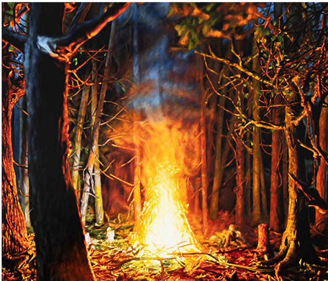
"Nun legt euch ans Feuer ihr Kinder und ruht euch aus, wir gehen in den Wald und hauen Holz. Wenn wir fertig sind, kommen wir wieder und holen euch ab", (Detalle) 2018. Oleo sobre lienzo 245 x 175 cm