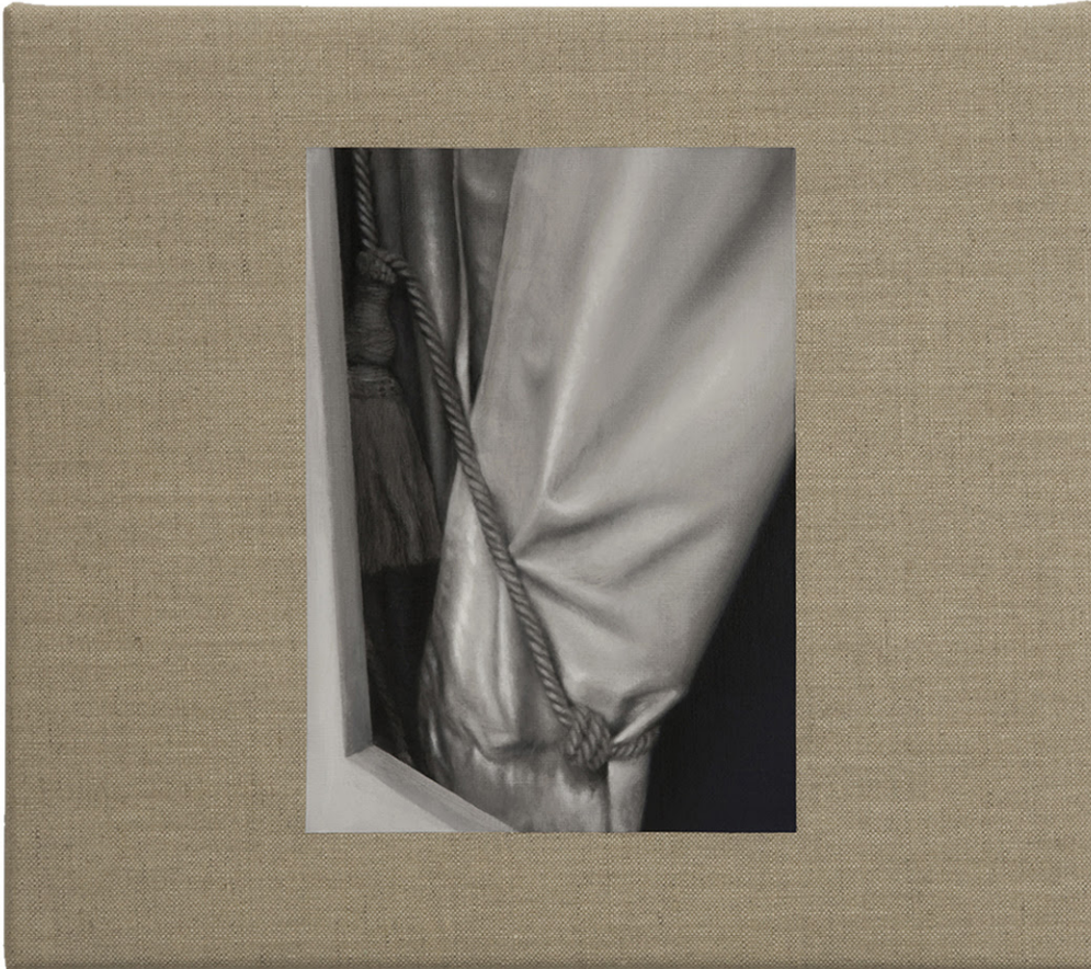
"The Age Of Anxiety IV", 2018. Oleo sobre lino, 30 X 40 cm